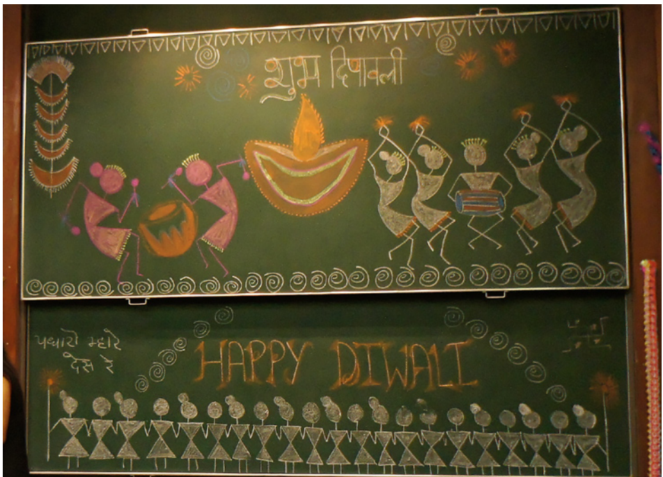
Abb. 4: Der dekorierte Hörsaal des MPI für experimentelle Medizin.