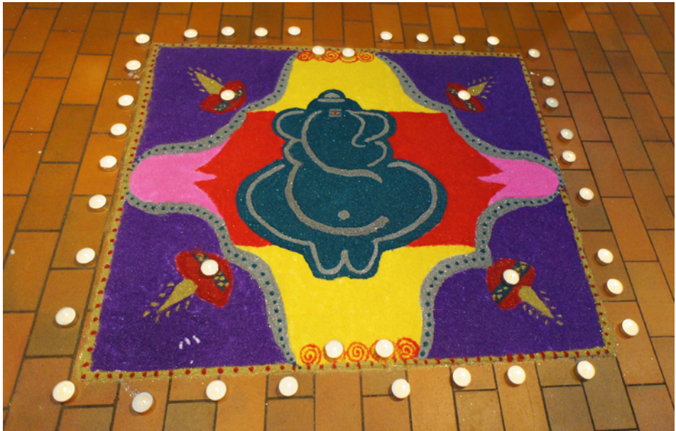
Abb. 3: Rangoli zu Diwali 2014: In der Mitte des Kreises ist Ganesha abgebildet.